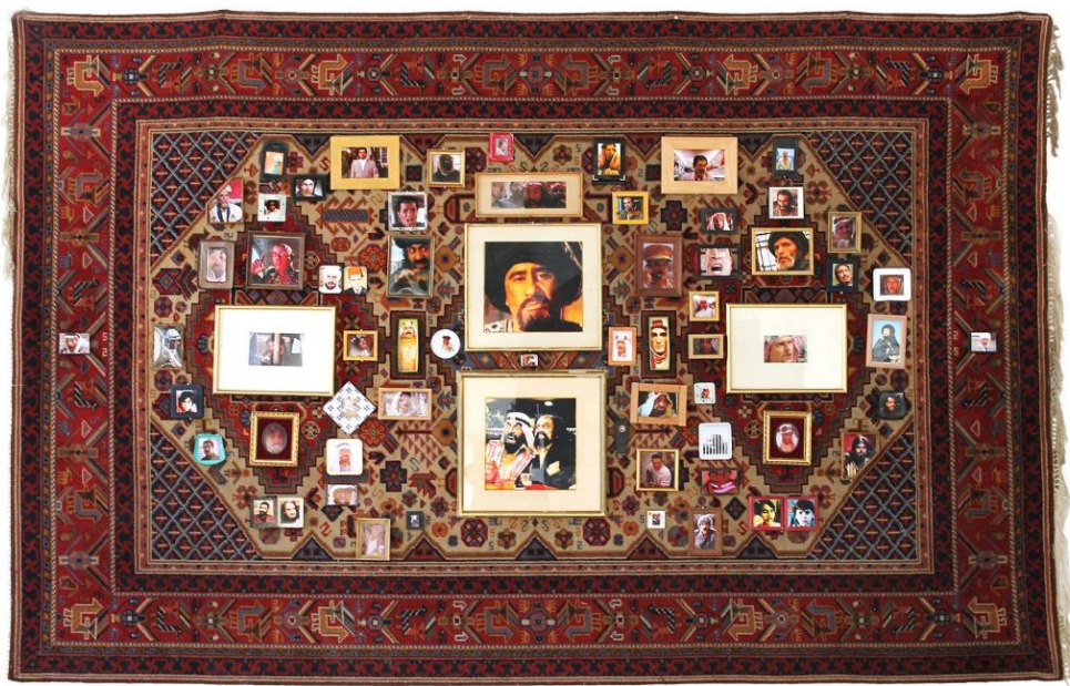
Wall of Fame #2, 2015

200 x 300 cm, tapis, cadres divers, impression jet d'encre, poussière