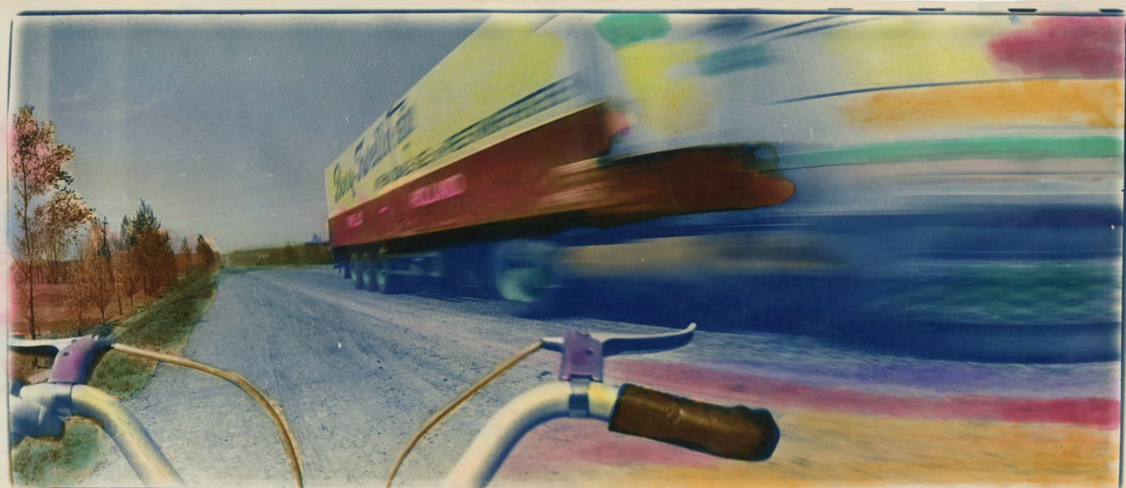
Viktor et Sergiy Kochetov, Bridge over Dnipro , 1995; Circle road around Kharkiv , 1989, tirage gélatino-argentique coloré manuellement