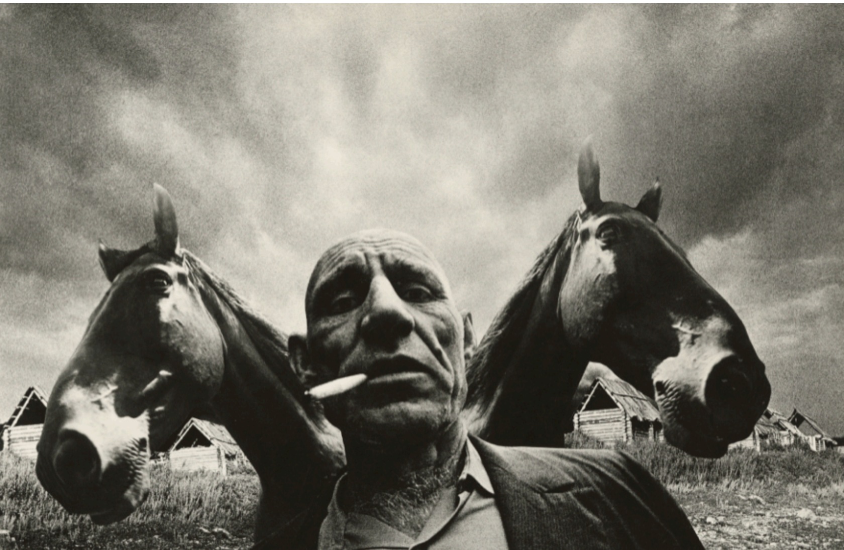
Oleksandr Suprun, The Three , 1979, tirage gélatino-argentique, collage analogue